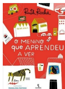
MENINO QUE APRENDEU A VER Ruth Rocha Ed. Salamandra ISBN: 978-8516088200