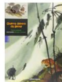
GUERRA DENTRO DA GENTE Paulo Leminski Ed. Scipione ISBN: 978-8526263666