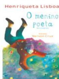
O MENINO POETA Henriqueta Lisboa Editora Peirópolis ISBN: 978-8575965856