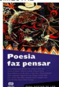
POESIA FAZ PENSAR Carlos Drummond de Andrade e Outros – Para Gostar de Ler Ed. Ática ISBN: 978-8508147557