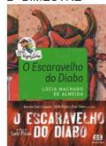
O ESCARAVELHO DO DIABO Lucia Machado de Almeida Ed. Ática ISBN: 978-8508173532