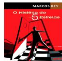
O MISTÉRIO DO CINCO ESTRELAS Marcos Rey Ed. Global ISBN: 978-8526009981

OBS: TODO O MATERIAL PODERÁ SER ENCONTRADO NAS PAPELARIAS ABAIXO. VALE RESSALTAR QUE É APENAS UMA INDICAÇÃO, FICANDO A CRITÉRIO DOS PAIS ESCOLHEREM O MELHOR LUGAR PARA A COMPRA DOS MATERIAIS.