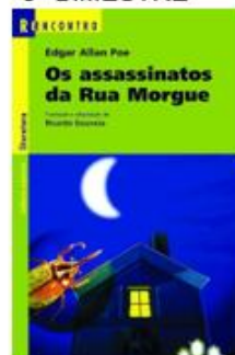
OS ASSASSINATOS DA RUA MORGUE Edgar Allan Poe Ed. Scipione ISBN: 978-8526283411

OBS: TODO O MATERIAL PODERÁ SER ENCONTRADO NAS PAPELARIAS ABAIXO. VALE RESSALTAR QUE É APENAS UMA INDICAÇÃO, FICANDO A CRITÉRIO DOS PAIS ESCOLHEREM O MELHOR LUGAR PARA A COMPRA DOS MATERIAIS.