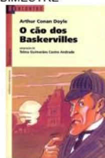
O CÃO DOS BASKERVILLE Arthur Conan Doyle Ed. Scipione ISBN: 978-8526280168