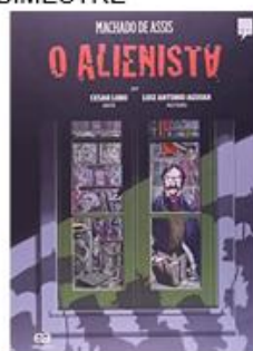
O ALIENISTA Machado de Assis Ed. Ática ISBN: 978-8508157341