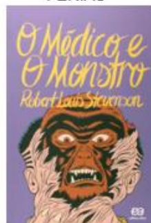
O MÉDICO E O MONSTRO Robert Louis Stevenson Ed. Ática ISBN: 978-8508145515